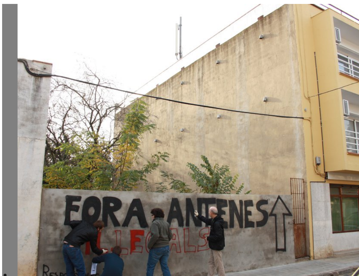
Una protesta dels veïns, de l'any 2011, contra l'antena del carrer Balmes.