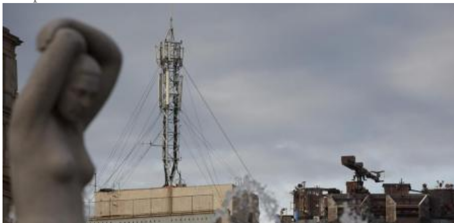
Imagen de una antena de telefonía móvil Mané Espinosa

El Ayuntamiento de Sant Boi de Llobregat ha comenzado los trámites para autorizar una instalación en Marianao, cuatro meses después de retirar otra