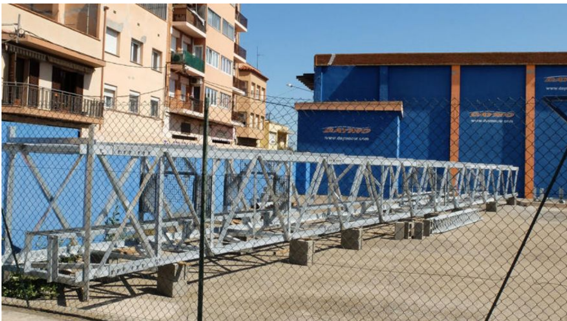
L'antena de telefonia mòbil que no es va poder instal·lar DIARI DE GIRONA

L'equip de govern de Figueres ha autoritzat la instal·lació d'una antena de telefonia mòbil al cementiri municipal . La darrera Junta de Govern va aprovar la llicència d'obra major sol·licitada per l'empresa Telxius Torres España SL, vinculada a Movistar, per col·locar una estació base de telefonia mòbil en una