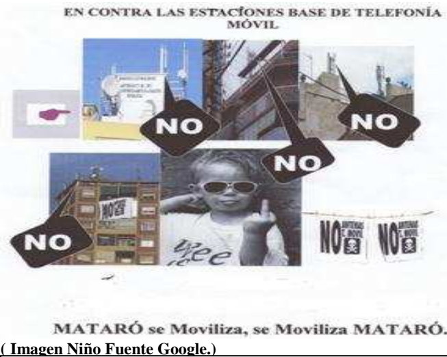
( Imagen Niño)

INFORMACIÓ PER ALS VEÏNS sobre les Microones de les Antenes. Us Convidem a participar i difondre. ◊ Un paisatge molt habitual: Instal·lació A.T.M. i Comunitats de Veïns.