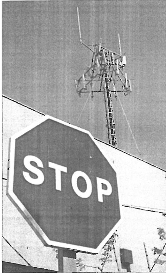
Aquesta és l'antena que domina l'avinguda Ginjollers