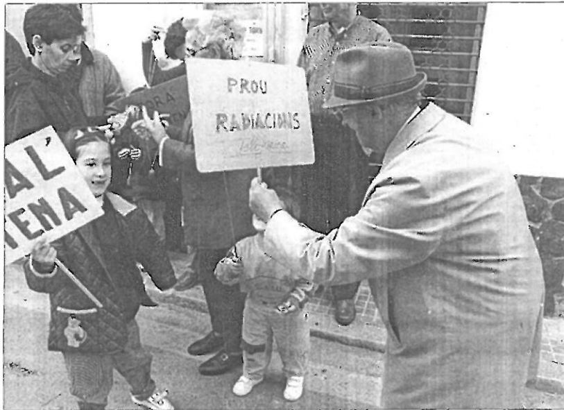
Els més petits de l'Escala també es varen afegir a la concentració pacífica de dissabte a la tarda

Un dels portaveus de l'Associació de Veïns contra Radiacions Nocives ha destacat que "hem fet medir dos cops el nivell de radiacions que emet l'antena sobre els edificis que té al seu voltant i dona entre