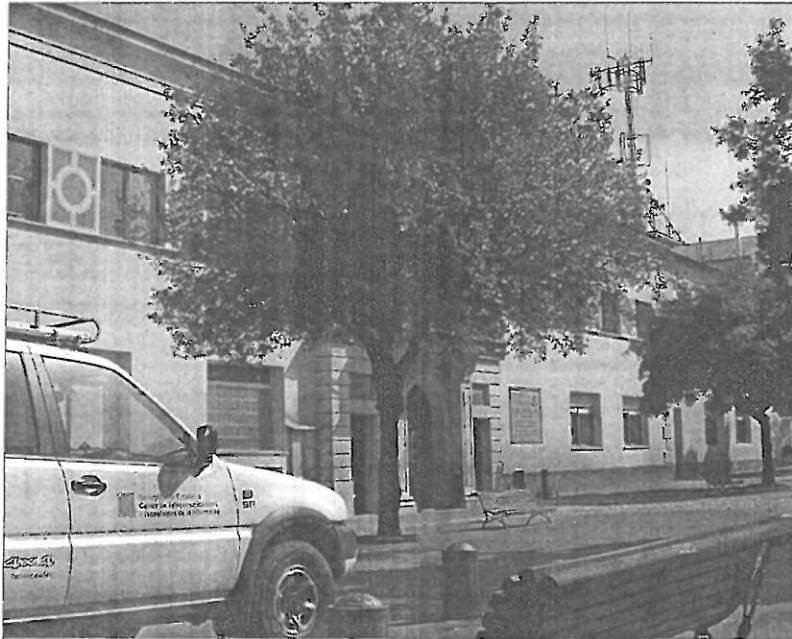
Tècnics de la Generalitat van mesurar totes les antenes de telefonia mòbil de Figueres

Malgrat això, tota vegada que aquestes dues medicions es van fer amb l'orientació actual dels panells de l'antena, s'ha plantejat l'interrogant del que va passar abans d'aquesta data, moment en què un dels panells estava dirigit cap a un dels patis de l'escola. L'informe dels tècnics de la Generalitat indica que "segons les dades de potència, en el cas més desfavorable, i considerant que un dels patis de l'escola estava en