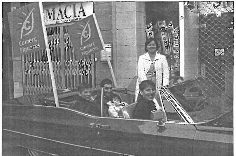
La guanyadora dels 5.000 euros de Comerç de Figueres va fer les compres

Finalment els monitors afirmen que la valoració que fan "és molt positiva, tot i reconèixer que sempre hi ha coses a millorar. No ens podríem quedar de braços plegats davant aquestes veus negatives que queden contrastades amb l'impagable somriure dels nens i nenes del Parc i les nombroses felicitacions per part de pares i mares".