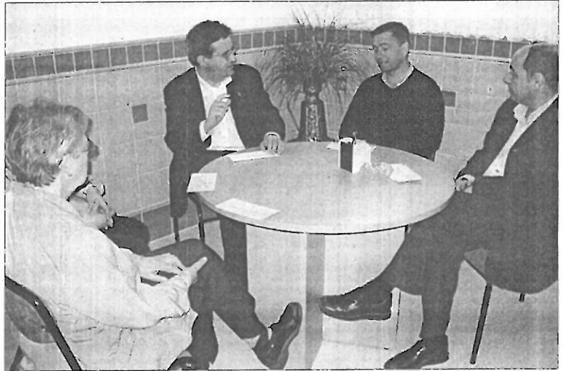
L'alcalde de Figueres, reunint-se amb els representants de la comunitat educativa de les Escolàpies

L'Ajuntament de Figueres ha decidit promoure dos actes "de cara a generar un clima de tranquil·litat i confiança a la comunitat educativa". Aquest dilluns es va celebrar una conferència al Teatre Municipal El Jardí, a càrrec dels diputats al Parlament de Catalunya del PSC: Ciutadans pel Canvi, Miquel Barceló i Pilar Díaz, doctor enginyer industrial i