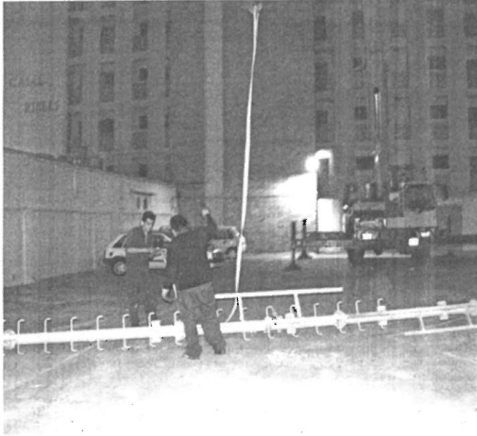
Un dels pals de l'antena, després de desmuntar-lo. / ROBERT CARMONA.

Operaris contractats per Retevisión ja van començar a treballar ahir per desmuntar tots els aparells tecnològics i preparar la retirada dels dos pals me-