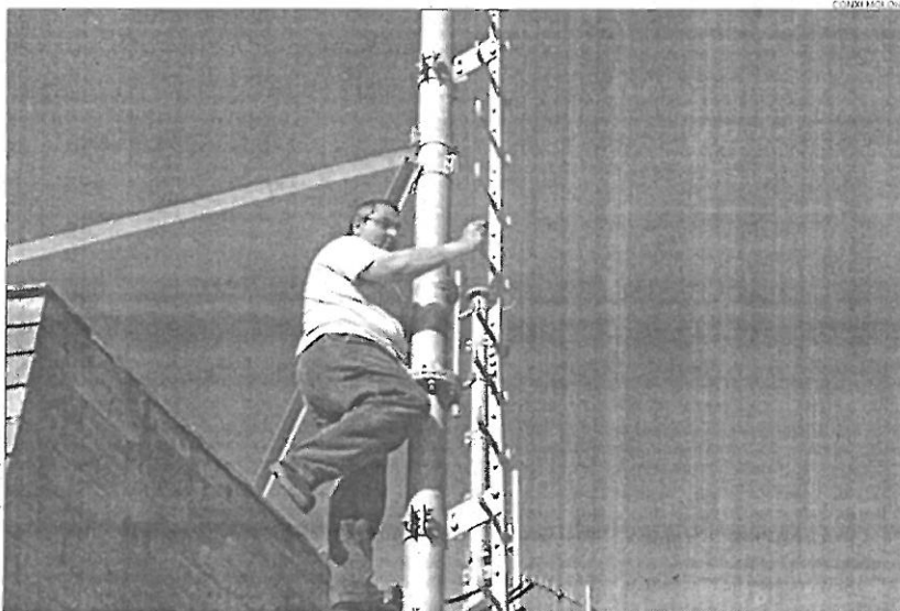
Retiren l'antena. Una grua va procedir ahir a retirar l'antena il·legal de Riells de Dalt de l'empresa Retevisión.

Els operaris van començar a desmantellar-la ahir a dos quarts de quatre de la tarda però fins ben bé a les sis no va arribar una grua de seixanta metres que va permetre baixar el conjunt de la instal·lació. L'operació es va portar a terme amb tota normalitat sota la supervisió d'agents de la Policia Local i sense la presència de veïns ni representants municipals.