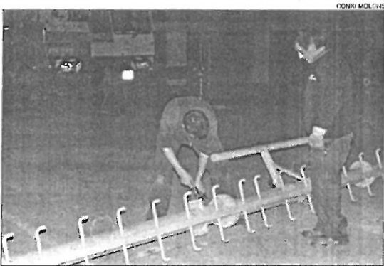
Desmantellar. Els operaris desmantellen la instal·lació.

L'Ajuntament de l'Escala havia denegat per quatre vegades la llicència a Retevisión. Des de feia dos anys, aquest cas es trobava als jutjats. Aquesta antena incomplia la normativa urbanística municipal ja que sobrepassava l'alçada permesa —l'edifici ja és més alt del que per-