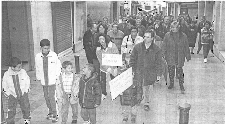
Els veïns van recórrer diversos carrers del centre de la població per protestar per la propera reinstal·lació de l'antena de Telefónica.

A la manifestació d'ahir els veïns també duïen pancartes, en què es podia lle-