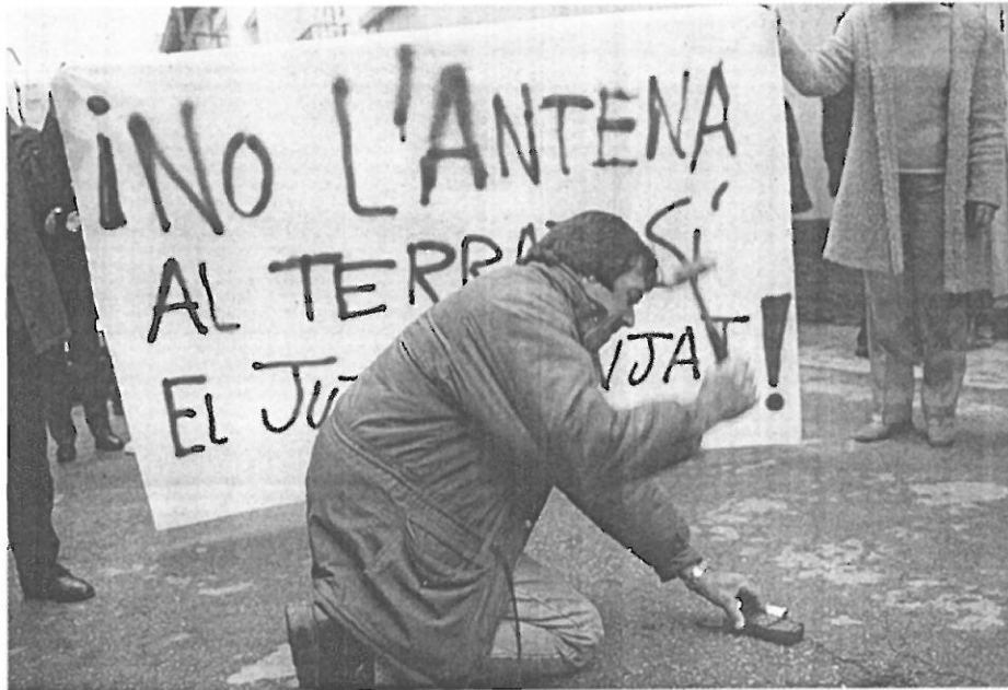
Un veí va trencar un mòbil a cops de martell ahir, durant una manifestació de protesta contra Telefónica. /R.C.

Els serveis jurídics municipals també preparen una querrela contra Telefónica per un presumpte delictu contra el medi ambient i estralls a la població. Guinart manté que l'antena del carrer del Port incomplia tant la normativa urbanística local com la de la Generalitat i que