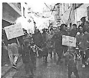
La manifestació, ahir.

● Uns 150 veïns de l'Escala van manifestar-se ahir contra Telefónica i contra la reinstal·lació de la polèmica antena, que s'ha previst per dimarts. L'Ajuntament, per la seva part, anuncia que, si la