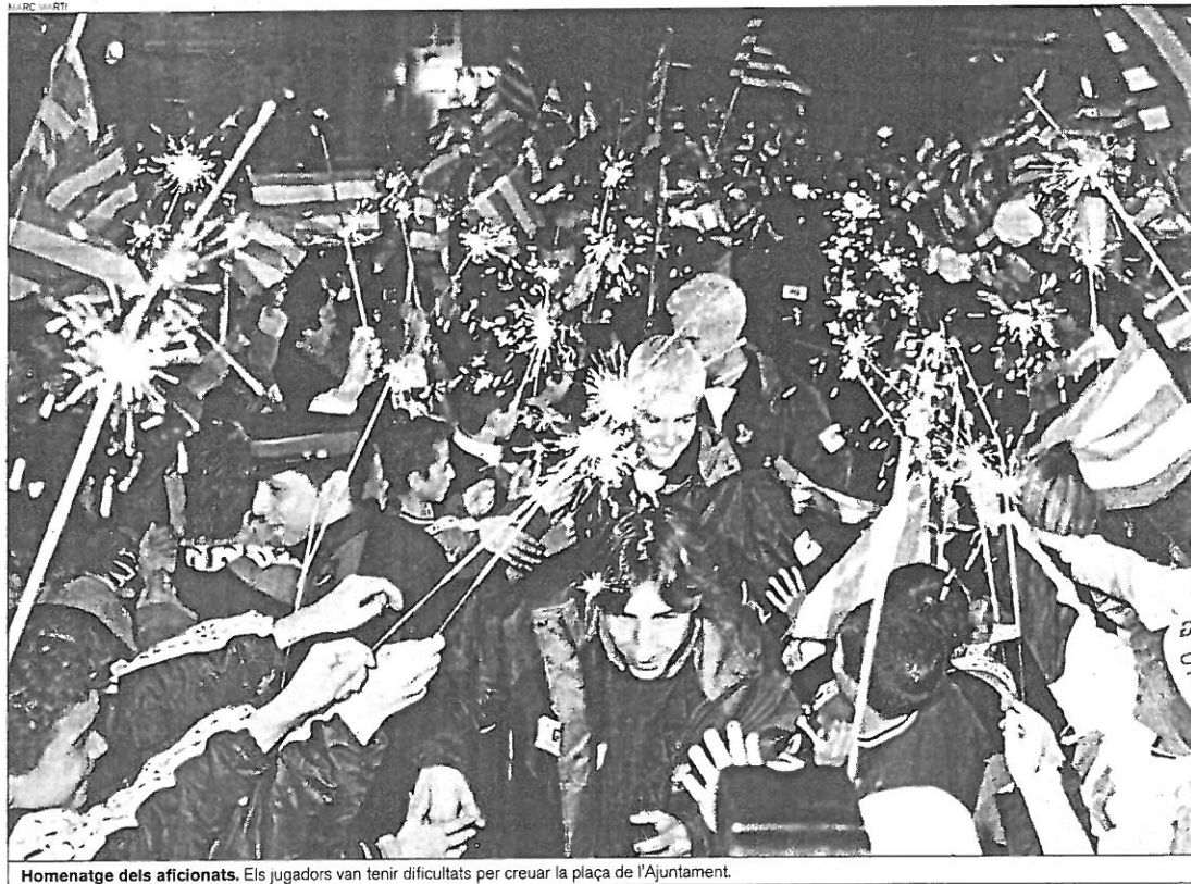
Homenatge dels aficionats. Els jugadors van tenir dificultats per creuar la plaça de l'Ajuntament.

DOS EXALTS CÀRRECS DE LA CONSELLERIA HAN ESTAT CITATS COM A IMPUTATS