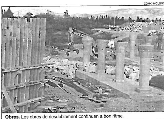
Obres. Les obres de desdoblament continuen a bon ritme.

Les obres amb un pressupost de 380 milions de pessetes, formen part del projecte aprovat per la direcció general de Carreteres i preveu la construcció d'un nou pont sobre la Muga i dues rotondes en el seu marge esquerre, amb un vial